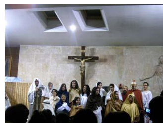
Representación del Nacimiento de Jesús 18-12 2005