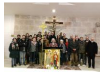
Don Carlos con la 3ª Comunidad