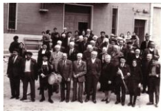
Feligresía años 60