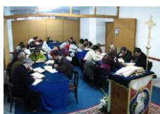
Scrutatio con jóvenes