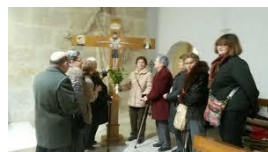
La Cruz de la Asamblea Diocesana