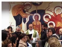
Don Carlos Bendiciendo el Catecumenium