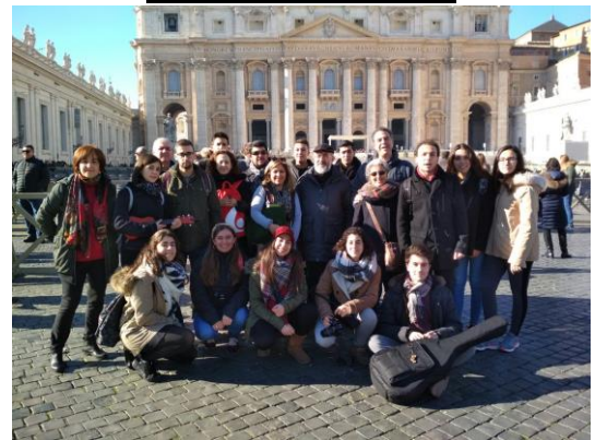
Peregrinación a Roma

Jóvenes de Postconfirmación con el Párroco y sus Padrinos