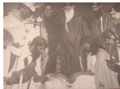
Adoración de los Reyes Magos