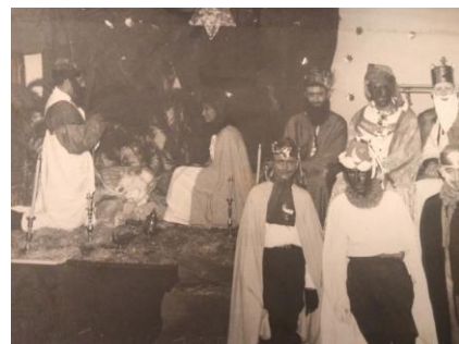
Representación navideña