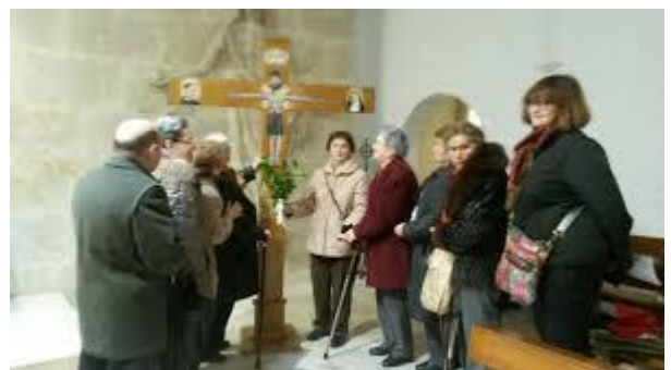
La Cruz de la Asamblea Diocesana visitó nuestra Parroquia