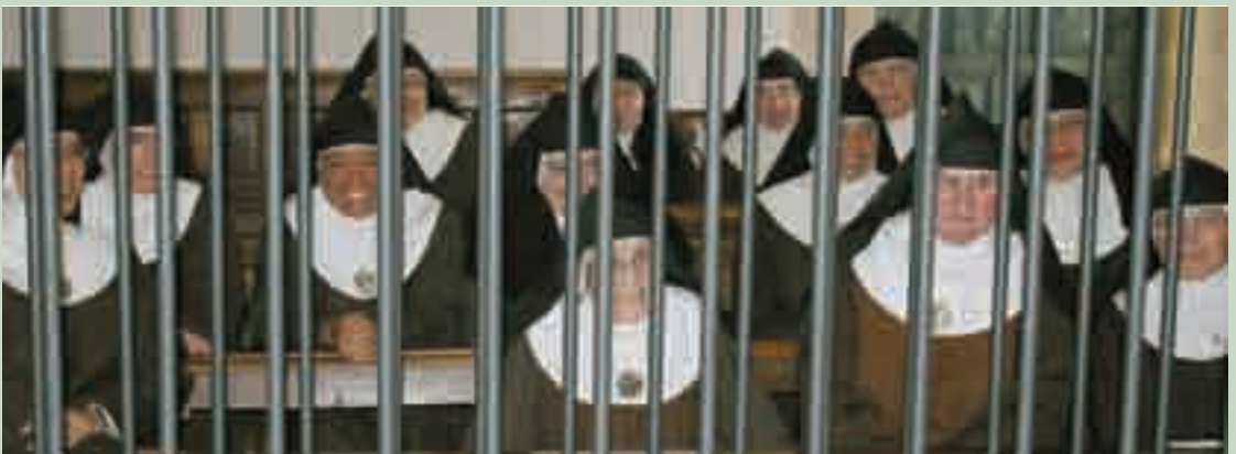
Monjas Clarisas del Convento de Santa Clara

NOS ACOGIERON CON UNA INMENSA HOSPITALIDAD, ALEGRÍA Y CARIÑO