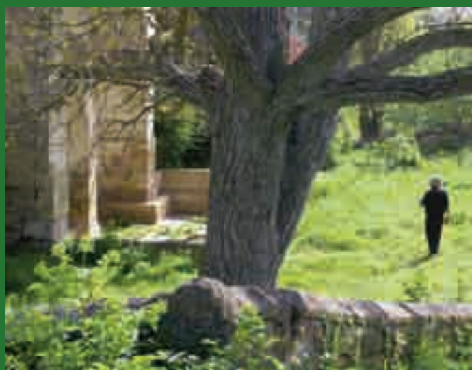
Paseando por los alrededores del Convento