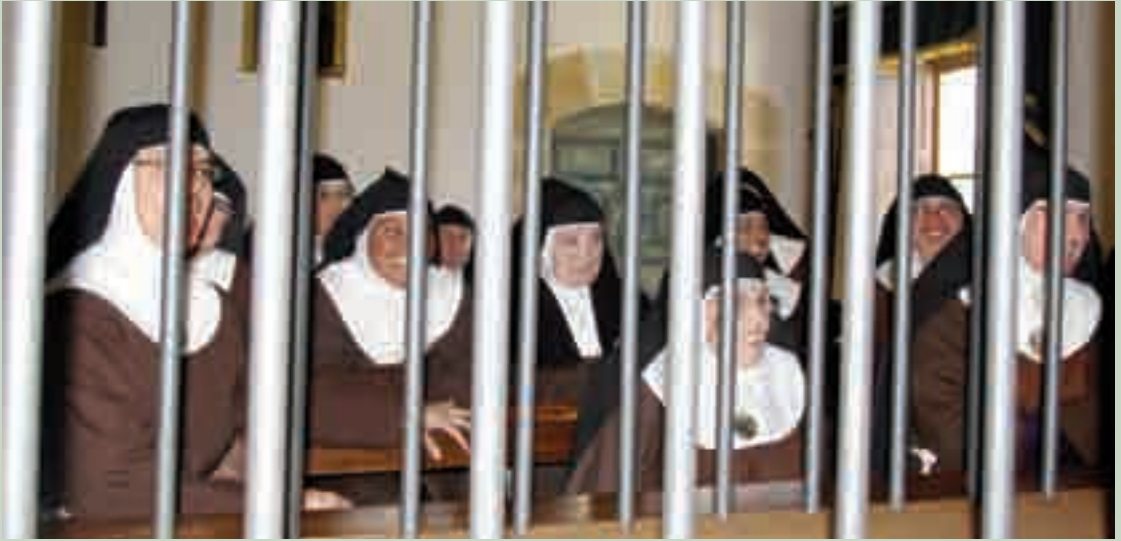
Monjas Clarisas hablando con el presbítero.

DE LO QUE REBOSA EL VASO ES DE LO QUE SE PUEDE DAR