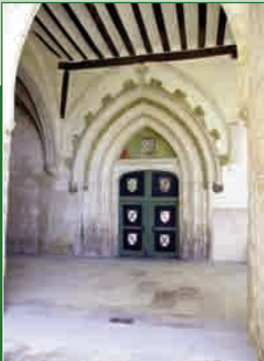
Entrada del Convento

DE LO QUE REBOSA EL VASO ES DE LO QUE SE PUEDE DAR